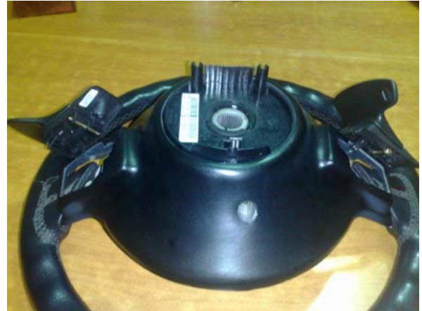
AGGANCIARE I PADDLE AL CABLAGGIO