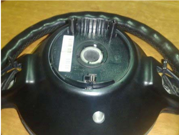
POSIZIONARE IL COPERCHIO POSTERIORE