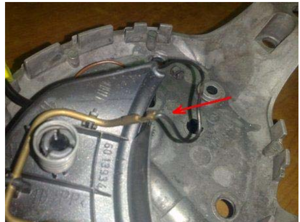
AGGANCIARE LO SPINOTTO DEL CLACSON