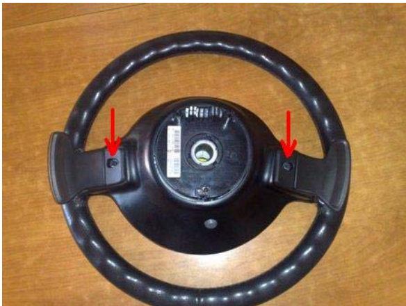
AVVITARE I PADDLE CON LE VITI E BUOLLONI FORNITI NEL KIT